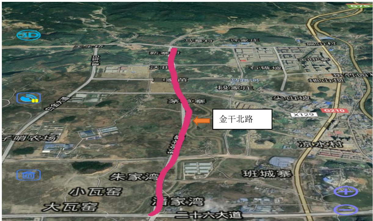
图 4-2 金干北路位置图

本项目起点位于沙文镇潘家湾，与麦沙大道平交，上跨麦架河、经潘家湾、新寨二组，终点与青山路相接，道路全长 3851.394m；主要占用荒山和建设用地。位置图见图 4-2。