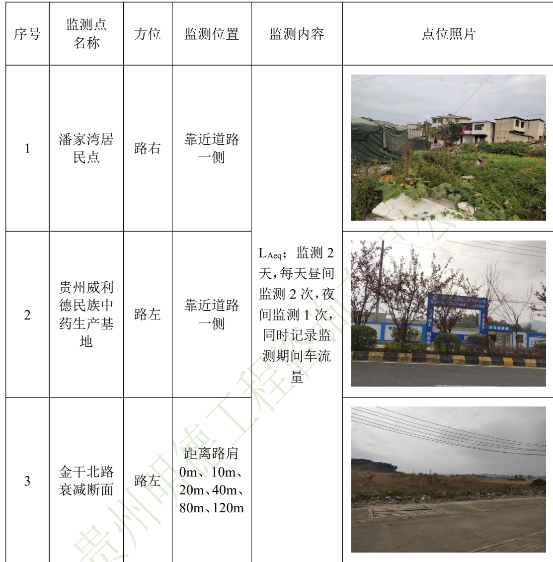
表 8-1 噪声监测点位及监测内容