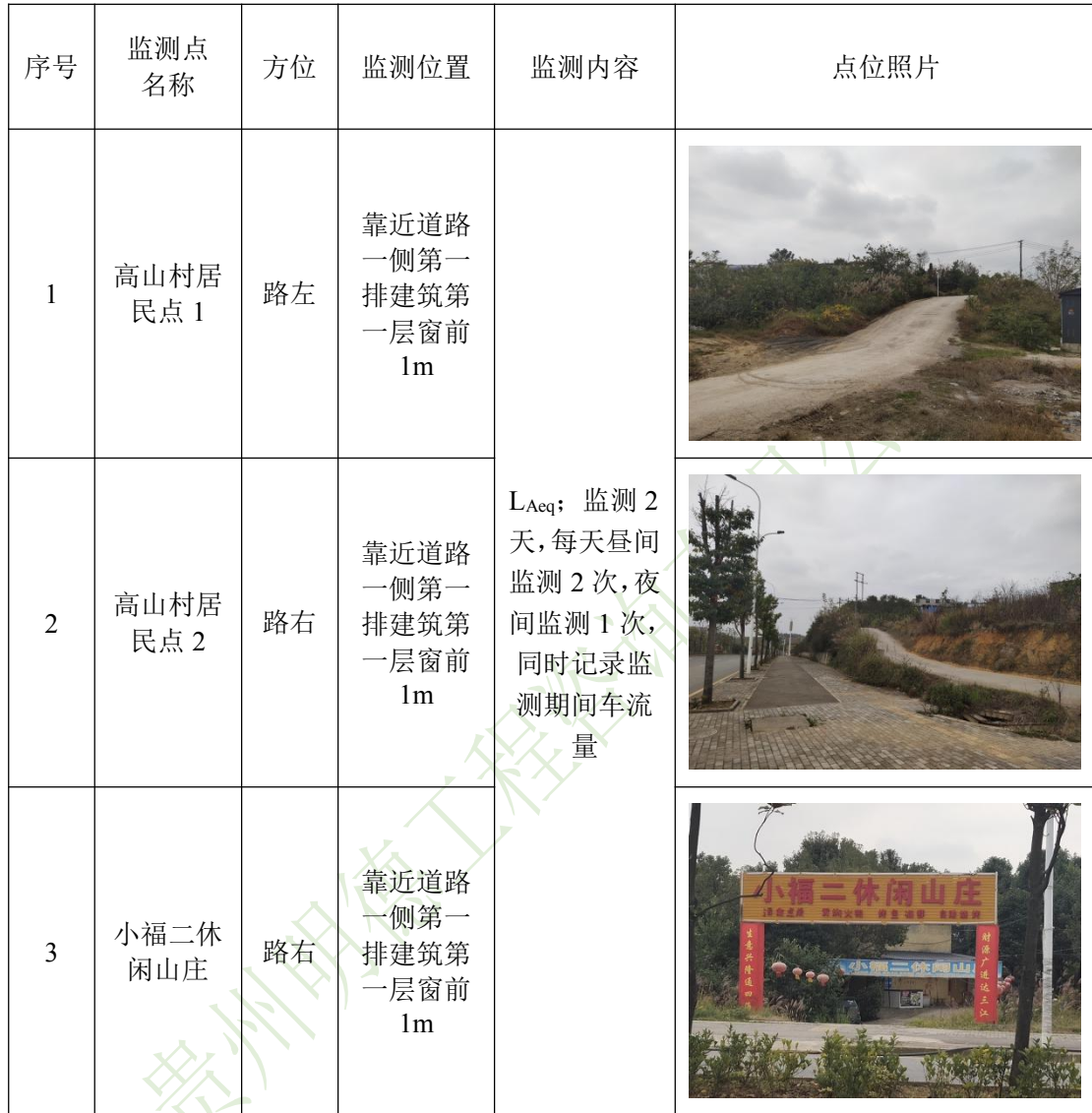
表 8-1 噪声监测点位及监测内容