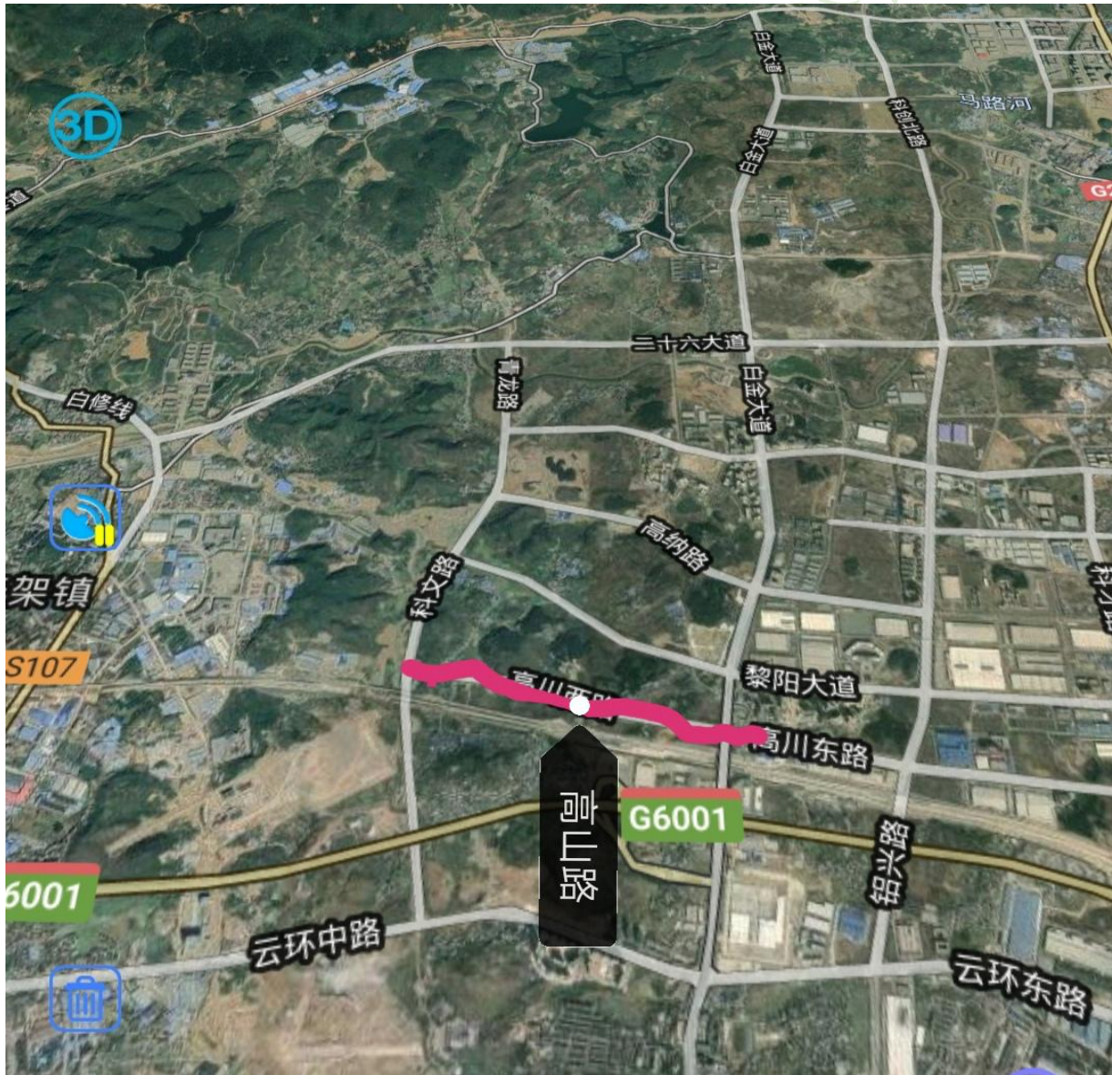
图 4-2 高山路位置图

本项目与绕城高速、麦苏路、苏庄路平行，西起规划的青龙路，向东经过高山村北侧，终点接金苏大道，道路全段长度 1572.941m。主要占用荒山和建设用地。位置图见图 4-2