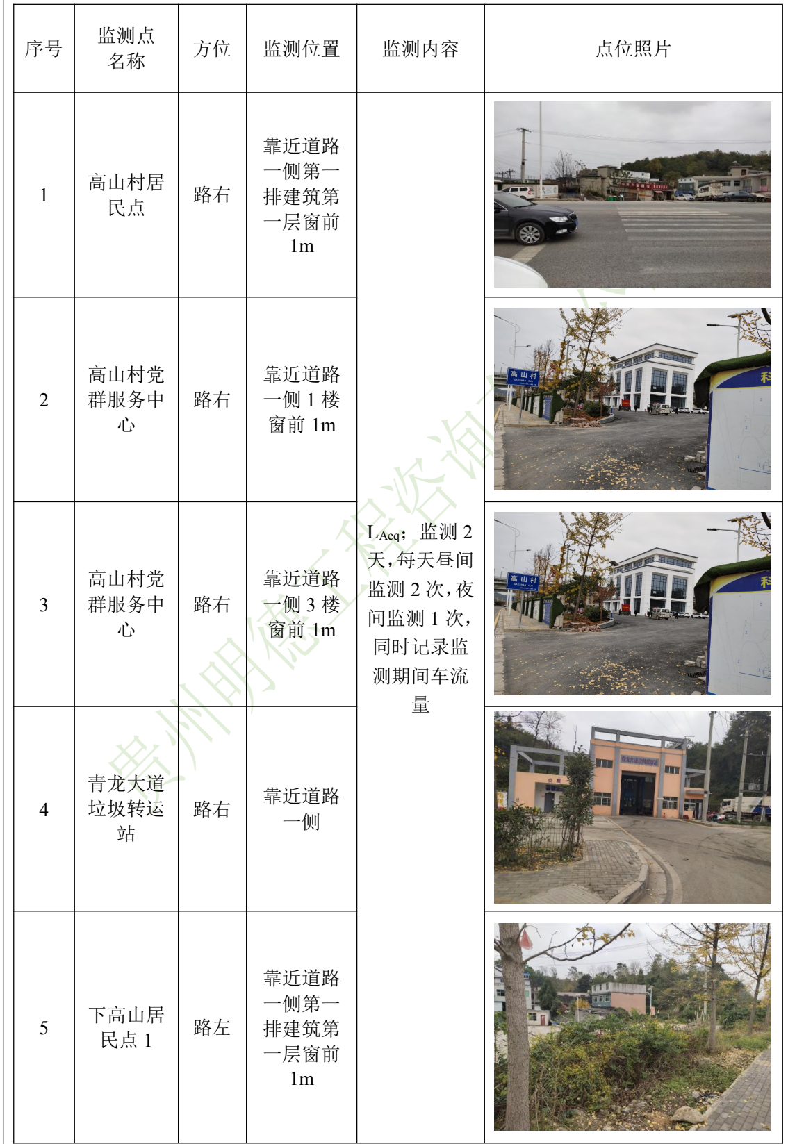
表 8-1 噪声监测点位及监测内容