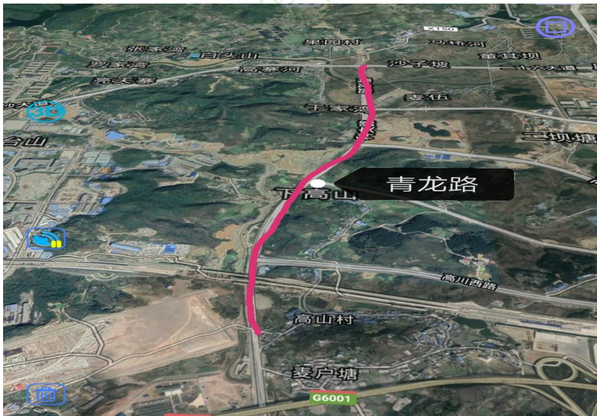
图 4-2 青龙路位置图

本项目起点位于白云区麦伍玫瑰基地, 接麦沙线桩号 k2+223 处; 沿线相交的主要道路有干田路、麦苏路、苏庄路、高山路、沙果南路, 终点接沙文生态科技产业园南面规划道路, 道路全长 3566.72m (本次实施 2810.793m); 主要占用荒山和建设用地。位置图见图 4-2