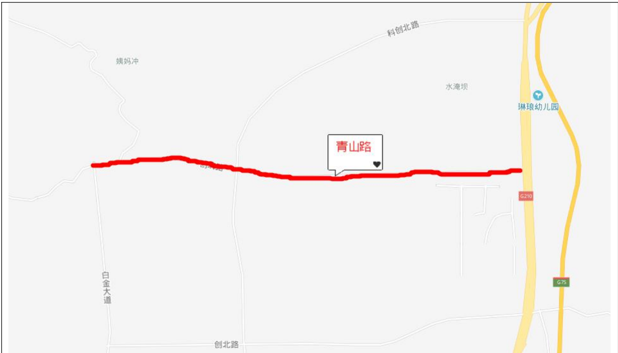
图 4-2 青山路位置图