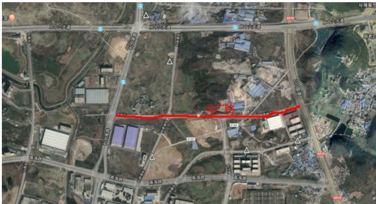
图 4-1 马厂路位置图