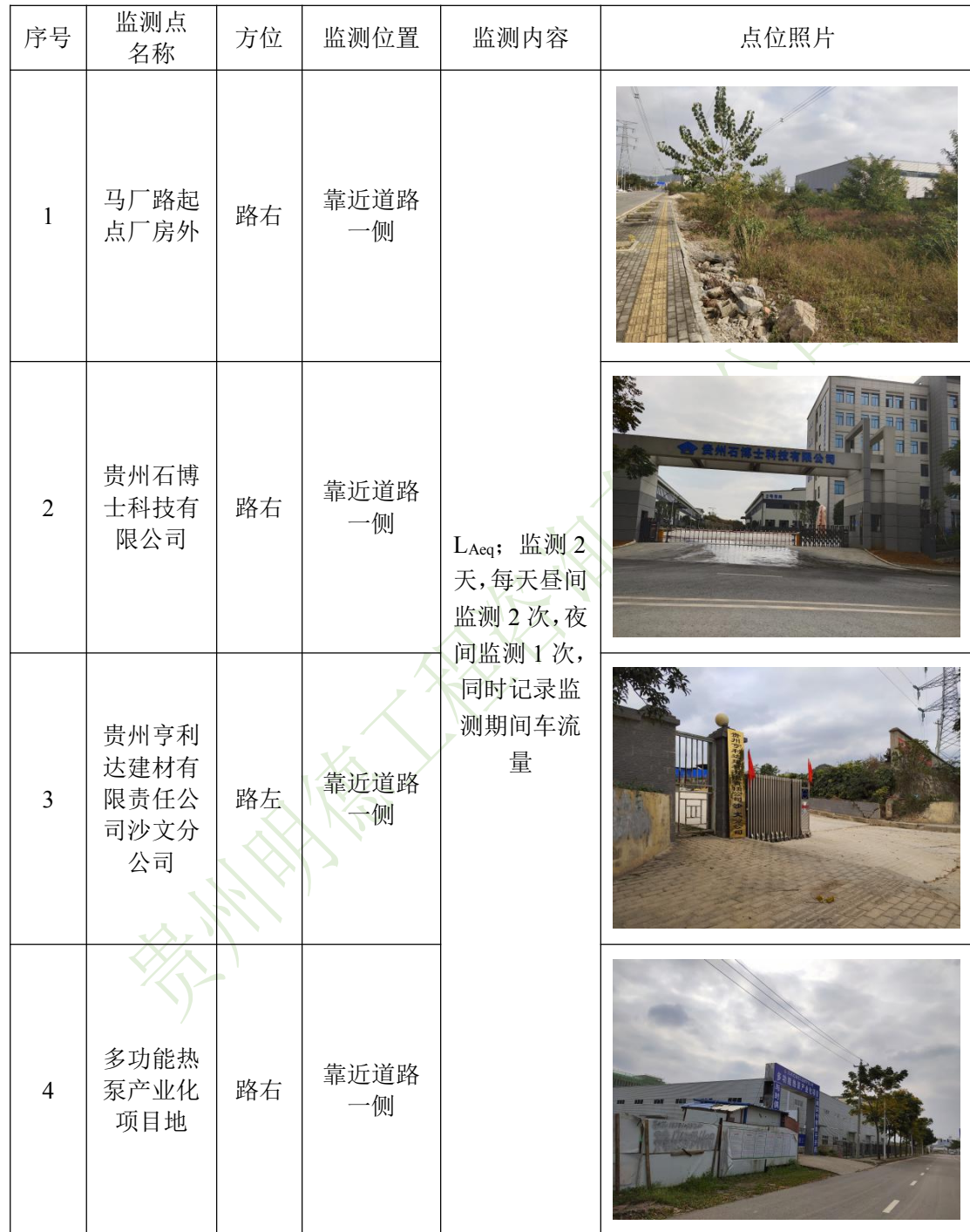
表 8-1 噪声监测点位及监测内容